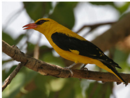
Männchen der Unterart Oriolus oriolus kundo

Pirole zeigen im Federkleid einen auffälligen Sexualdimorphismus. Das Männchen hat einen grell gelben Rumpf und schwarze Flügeldecken mit einem gelben Fleck am Flügel, die Schwanzfedern, der Stoß, sind schwarz mit zwei gelben Streifen. Junge Weibchen sind mattgrün gefärbt mit etwas hellerer, gesprenkelter Brust und Bauch und einem gelblichen Unterbauch. Diese Färbung verbessert die Tarnung beim Brüten auf dem Nest. Ältere Weibchen weisen zum Teil deutlich mehr Gelb im Gefieder auf. Ihr Gelbanteil ist mitunter größer als das von dreijährigen Männchen, so dass die Geschlechtsbestimmung anhand der Gefiederfärbung nur eingeschränkt möglich ist. [2]