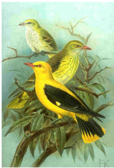
Pirol, im Vordergrund Männchen, dahinter Weibchen, ganz hinten ausgeflogener Jungvogel (Illustration von 1901)

Der Pirol ist ein schlanker Vogel, der eine Körperlänge bis 24 Zentimeter erreicht. Männchen wiegen im Durchschnitt 41 Gramm, die Weibchen dagegen 71,8 Gramm. [1] Beide Geschlechter zeigen einen rosa bis rostfarbenen Schnabel. Vom Schnabelgrund bis zum Auge reicht beim Männchen (und beim Weibchen im Fortschrittskleid) ein schwarzes Zügelband, bei jungen Weibchen ist dieses grau und weniger deutlich erkennbar. Beine und Krallen sind grau gefärbt. Die Augen haben einen bräunlichen, auch ins Rötliche gehenden Farbton.